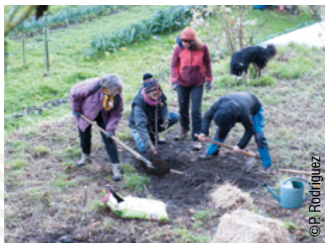
Huit arbres fruitiers ont été plantés