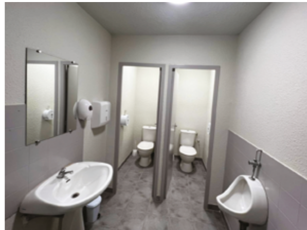
Les éléments des sanitaires du Centre Culturel ont été complètement changés en régie.

Les WC publics sous l'école sont en cours de transformation/rénovation : travaux également effectués par le service technique.