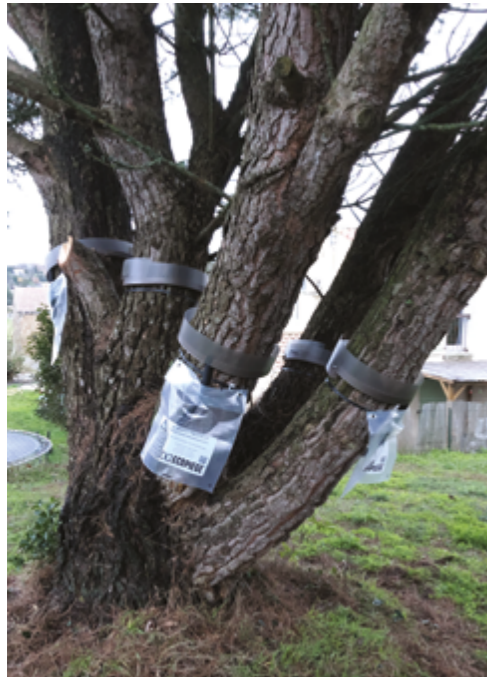
Le service technique de la commune a installé des pièges à chenilles processionnaires dans les lotissements.