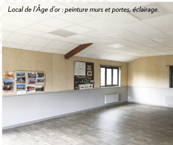
Local de l'Âge d'or : peinture murs et portes, éclairage.