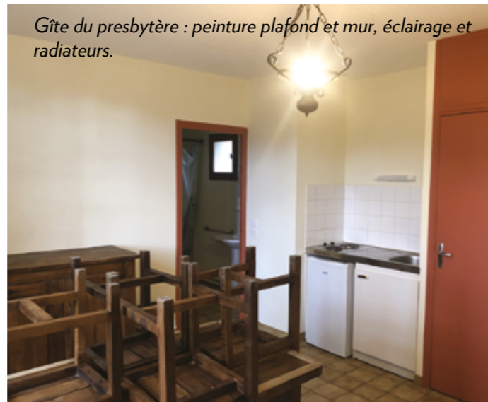
Gîte du presbytère : peinture plafond et mur, éclairage et radiateurs.